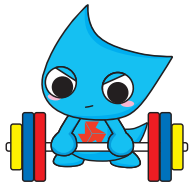
ウエイトリフティング