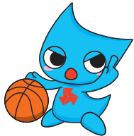
バスケットボール