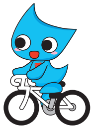
自転車競技 (トラック・ロード)